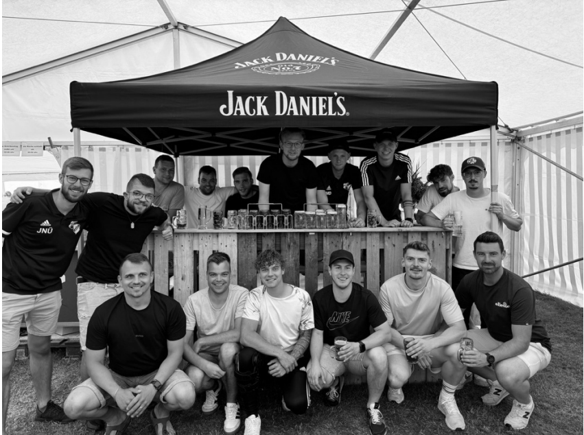
Beweis der guten Kameradschaft: Die Jungs auf der „Kirb“