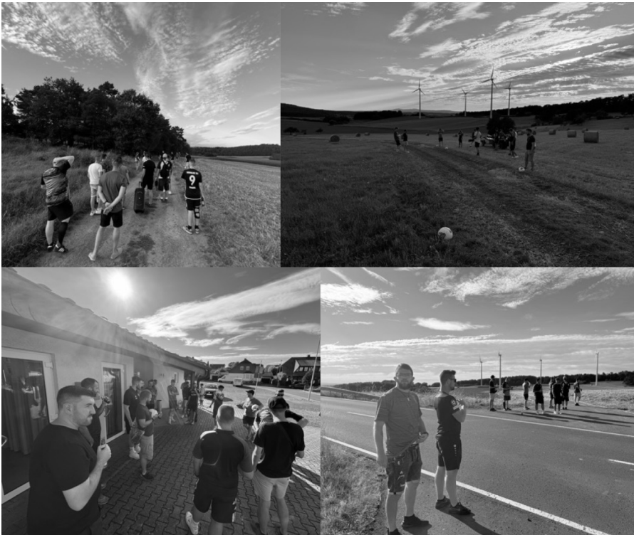
Unsere Mannschaft beim „Fußballbosseln“ in Fauerbach